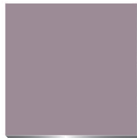
Spectra rose champagne 906