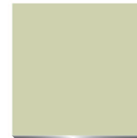
Spectra bronze 903